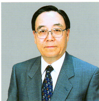
前駐スイス日本国大使